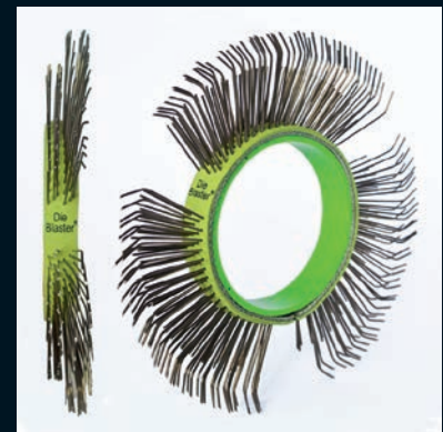
Die Blaster® Band, Federstahl, 11 mm, links