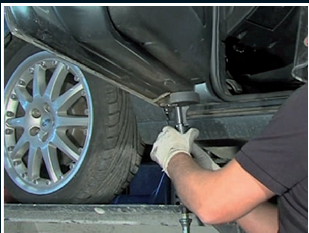
Türfalz / Türdichtung