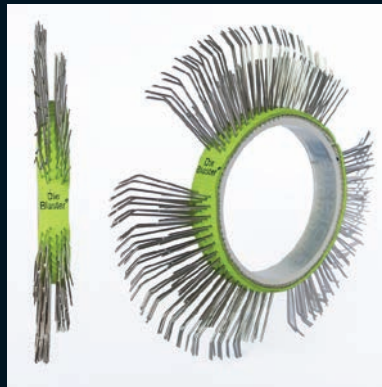
Die Blaster® Band, Edelstahl, 11 mm, rechts