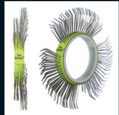
Die Blaster® Band, Edelstahl, 11 mm, links