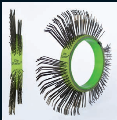
Die Blaster® Band, Federstahl, 11 mm, rechts