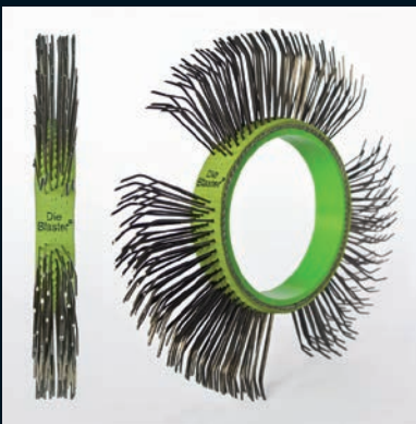
Die Blaster® Band, Federstahl, 11 mm